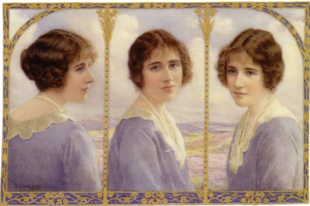
Lady Elizabeth Bowes-Lyons - Queen Mother 1900-2002

Les projets ne manquent pas pour nos escarboucléens en ce début d'année. Le voyage à Londres se concrétise du 25 au 28 mai.